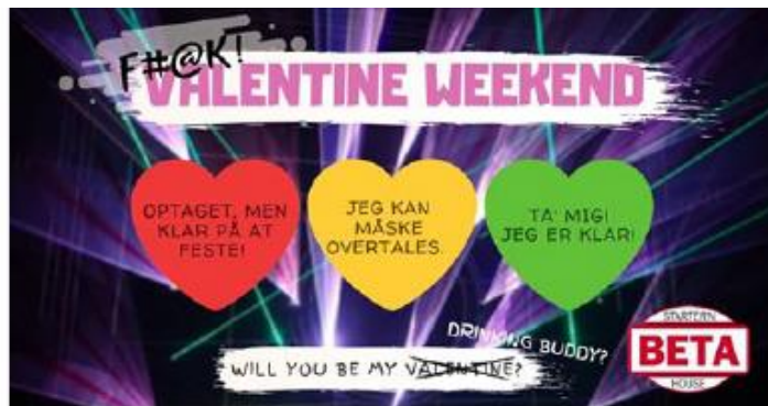
Figur 3 Beta House i Grenaa markedsføring på Facebook

♥♥♥ Valentine Weekend ♥♥♥ Single and ready to mingle? → Klistermærker uddeles i garderoben! ♥ Grøn - Ta' mig! Jeg er maks klar! ♥ Gul - Jeg kan måske overtales. 😞 ♥ Rød - Jeg er optaget, men klar på at feste!