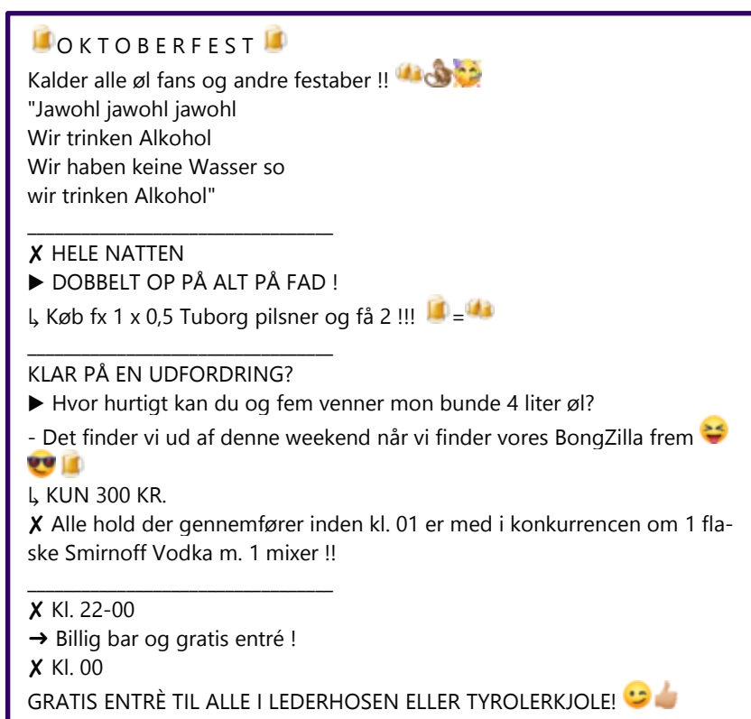
Figur 1 Beta House i Grenaa markedsføring på Facebook

Alkohol & Samfund vurderer, at diskoteket Beta House Grenaa overtræder retningslinje §3, stk. 2 om, at markedsføringen af alkoholholdige drikkevarer ikke må opfordre til et stort eller umådeholdent forbrug i teksten: