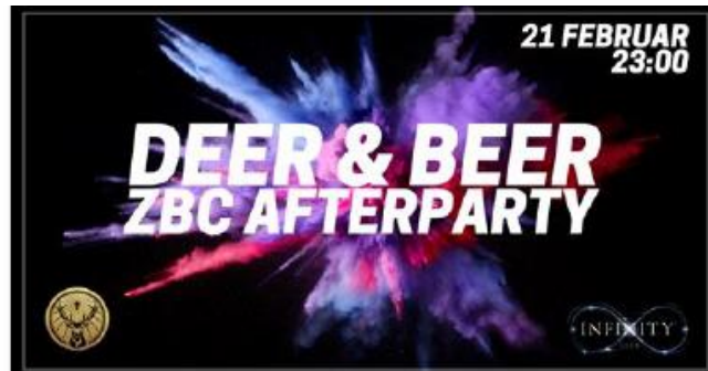
Figur 4 Infinity Club i Ringsted markedsføring på Facebook

RINGSTED AFTERPARTY! Som altid fylder de klubben med vilde festglade mennesker.